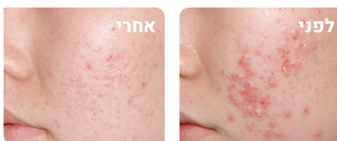
תוצאות מן הקליניקה